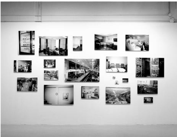
STATISTICAL LANDSCAPE, GALERIE MERCER UNION, TORONTO, 2004.

The problem of representation raised in Un ça, un ours et le tonneau des Danaïdes leads Léonard to further develop the notion of portraiture, encompassing the question of both the viewing subject's and the author's points of view.