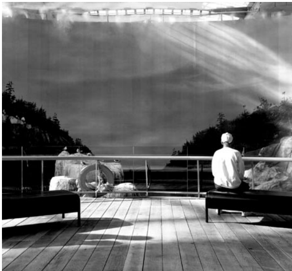
L'ÉBLOUI, ISSUE DE LA SÉRIE LES PANTOMIMES, PHOTOGRAPHIE COULEUR, 68 X 68 CM, 1999.

the gaze — as much that of the photographer-subject as the viewer's — and whose diversity betrays the artifice.