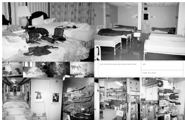
PAGES 8 ET 9 DU JOURNAL DANS L'ŒIL DU TRAVAILLEUR, 2001.

allowing them free rein as to framing and point of view, she invited them to appropriate these spaces — until then generally considered of no interest — by the novel approach of the camera's eye. This strategy allowed them to find their own “way of looking” and, in so doing, to reclaim their solitude. 2