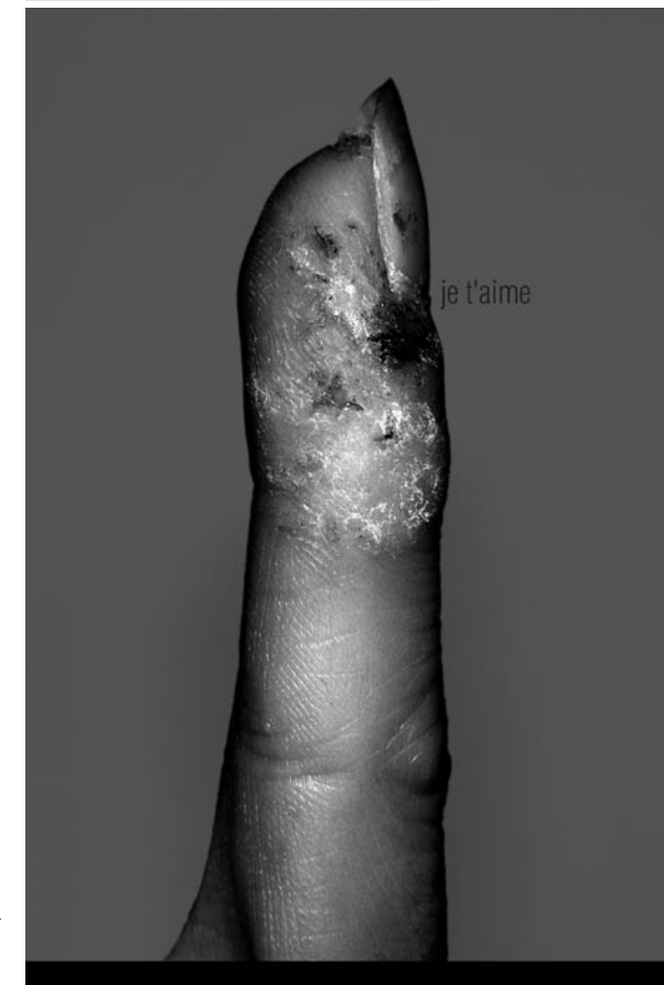
JE T'AIME, AFFICHE 120 X 200 CM, ÉDITIONS LE BLEU DU CIEL, BORDEAUX, GALERIE CLARK, MONTRÉAL, 2003.

Christian Bobin. “One doesn't learn by oneself of course. One has to go through someone else to reach one's own most hidden recesses.” 3 One's presence will always insinuate itself in the figure of the Other, as every representation implies the realization of one's own existence, one's ego. Every photographic document may thus claim the significance of autobiography, in as much as it examines the world and testifies to its author's existence.